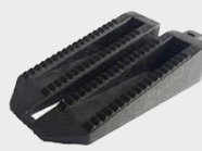
UNI Vyrovnávací klín