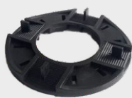
UNI Podkladový terč

PRO TERASY SE ZVÝŠENOU PODLAHOU Z KAMENNÝCH, BETONOVÝCH NEBO KERAMICKÝCH SILNÝCH DLAŽDIC